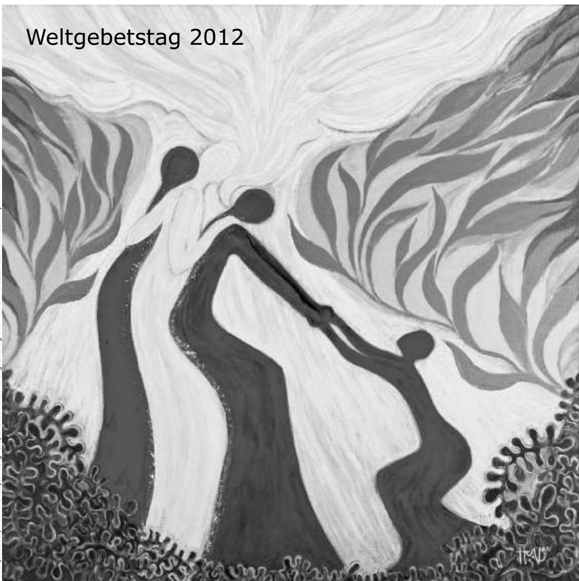
Foto: „Justice“, Hanna Cheriyan Varghese, Bildrechte bei Weltgebetstag der Frauen - Deutsches Komitee e.V.)