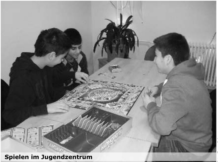
Spielen im Jugendzentrum